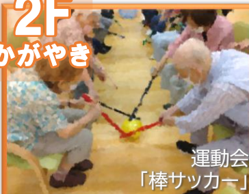
運動会 「棒サッカー」