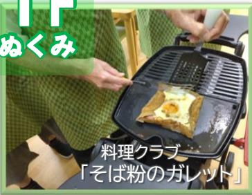
料理クラブ 「そば粉のガレット」