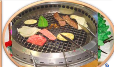
バザーお疲れ様会